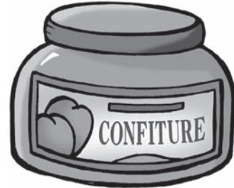
de la confiture