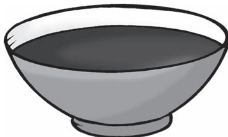
un bol de chocolat chaud/de café