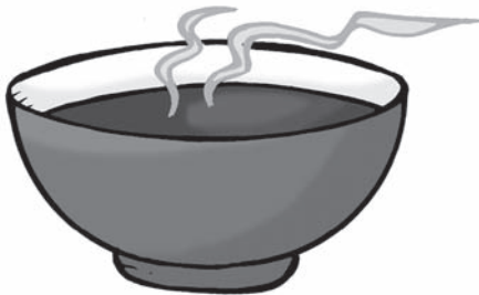
du chocolat chaud