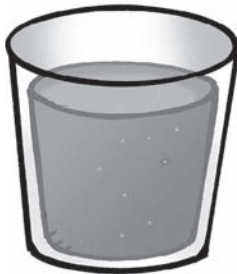
du jus d'orange